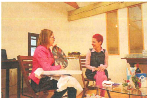
"Kaj za vraga naj kupim za darilo?"