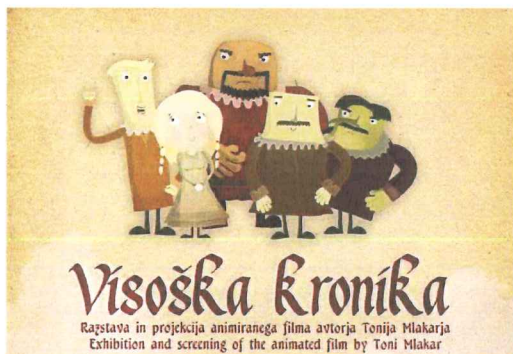
Plakat Visoška kronika