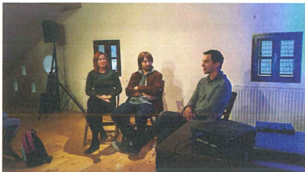
Pogovor z avtorjema filma ob otvoritvi razstave.

17.10.2015, Razstava karikatur nastalih na 4. slovenskem Festivalu karikatur