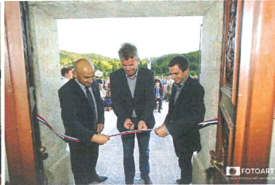
Foto utrinki otvoritve Šubičeve hiše, 8.9.2015