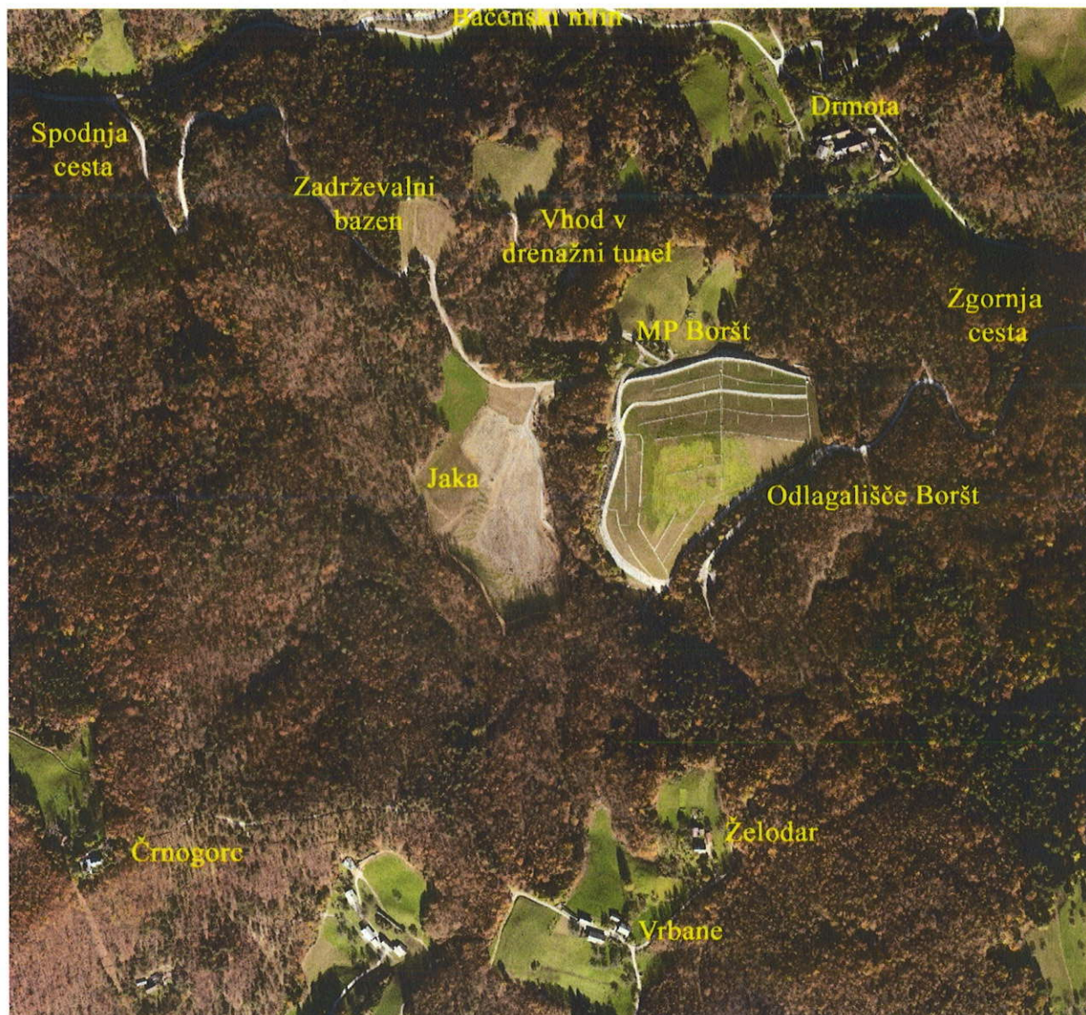
Priloga 2: Položaj posameznih objektov v neposredni bližini odlagališča hidrometalurške jalovine Boršt, stanje leto november 2010