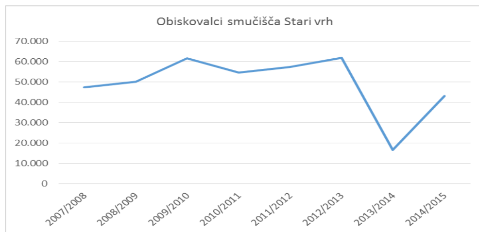
Graf 1: Obisk na smučišču Stari vrh 2007/08 – 2014/15

Graf prikazuje število smučarjev po sezonah.