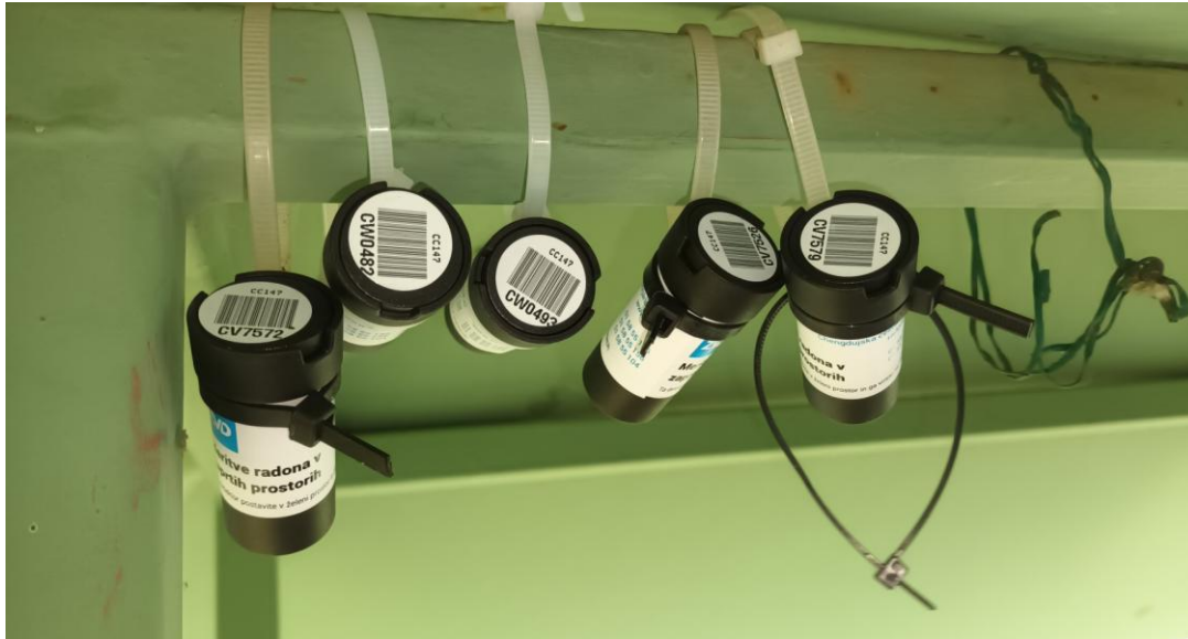
Slika 8: Meritve koncentracije radona z detektorji sledi na merilnem mestu.

ZVD d.o.o. je v letu 2020 pripravil poročilo o sistematičnem pregledovanju delovnega in bivalnega okolja (št. LMSAR-72/2020-PJ), kjer je zapisal “V obdobju november 1993 - februar 1994 so bile v okviru nacionalnega programa izmerjene koncentracije radona v približno 900 naključno izbranih stanovanjih na območju Slovenije. Iz povprečne vrednosti 87 Bq/m 3 je bila aproksimativno določena srednja letna vrednost, ki znaša 54 Bq/m 3 .” Iz navedenega je sicer pridobljene rezultate težko primerjati, saj so bile meritve opravljene tako zunaj kot znotraj objektov in so predvsem odvisne od geološke sestave tal, vrste meritev in vremenskih razmer.