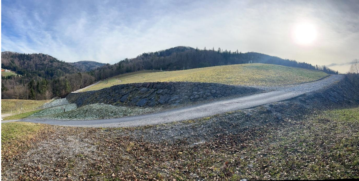
Slika 2: Odlagališče hidrometalurške jalovine Boršt

Značilnosti odloženega materiala na odlagališču Boršt so: