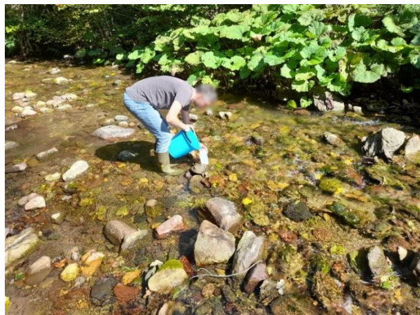
Slika 10: Vzorčenje vode v potoku Brebovščica.