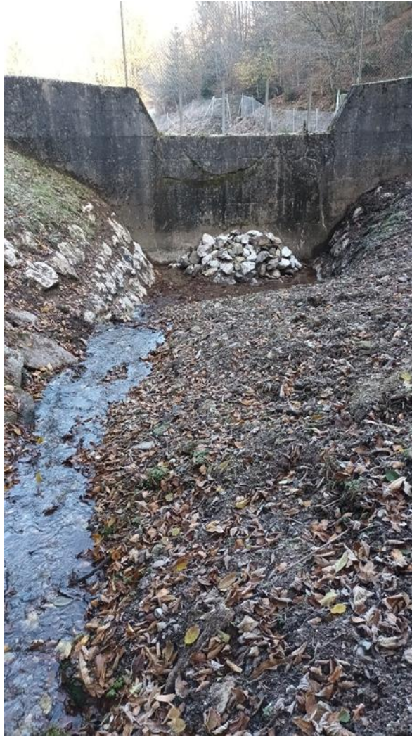
Slika 5: Očiščen zadrževalnik plavja na vtočnem objektu C odlagališča Jazbec.

Ogled drenažnega jaška in propusta pod odlagališčem Jazbec se izvaja na vsakih pet let. Zadnji ogled je bil izveden v novembru 2024. V letu 2019 je bil dodatno izveden tudi ogled drenažnega jaška in propusta pod odlagališčem Jazbec. Glavna ugotovitev izvedenega ogleda je bila, da se stanje propusta, drenažnega jaška in vtokov drenažnih sistemov od zadnjega nadzora, ki je bil izveden leta 2019 praktično ni spremenilo oziroma poslabšalo. Naslednji ogled drenažnih sistemov je načrtovan v letu 2029.