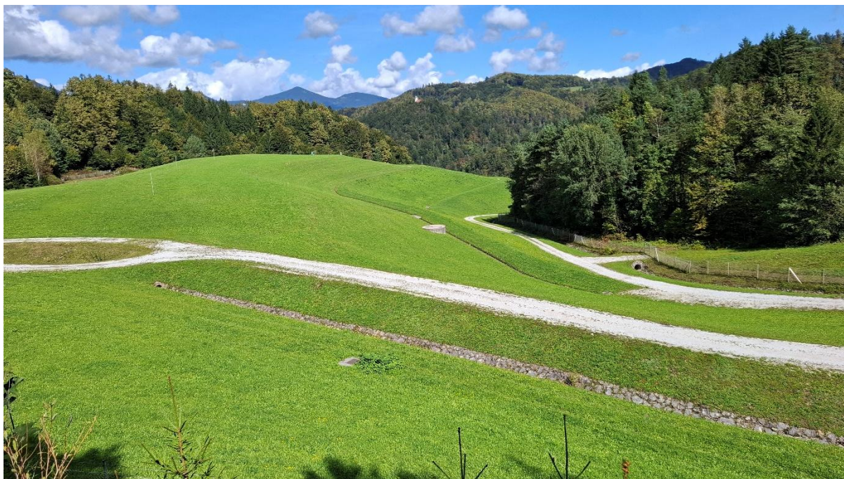
Slika 1: Zgodnji del odlagališča Jazbec.

Značilnosti odloženega materiala na odlagališču Jazbec so: