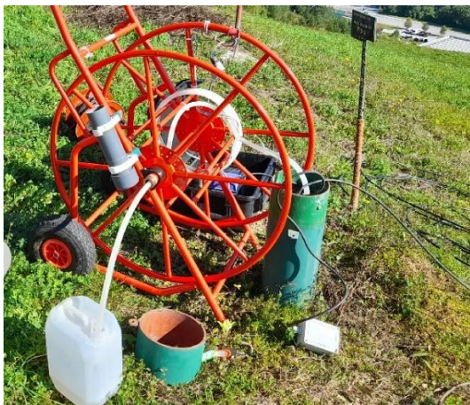
Slika 9: Vzorčenje vode iz piezometra.

V potoku BPG in Todraščici so bile v drugi polovici leta 2025 opravljene tudi meritve sedimentov. Meritev je opravil pooblaščen izvajalec monitoringa radioaktivnosti, rezultati so podani v tabeli 13.