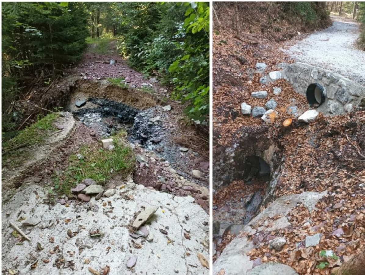
Slika 3 in 4: Dostopna cesta do preusmeritve potoka Jazbec v Brdarčkovo grapo. Slika 3 (levo) predstavlja stanje ceste po obilnem deževju, slika 4 pa stanje ceste po sanaciji.

V letu 2024 so bila izvedena še dodatna vzdrževalna dela. Saniran je bil spodnji del jarka 1. Očiščen je bil jarek za odvodnjavanje površinskih voda, ki odvaja vodo iz zgornjega platoja odlagališča v jarek 1. Izpraznjen in očiščen je bil tudi zadrževalnik plavja na vtočnem objektu C odlagališča Jazbec (slika 5).