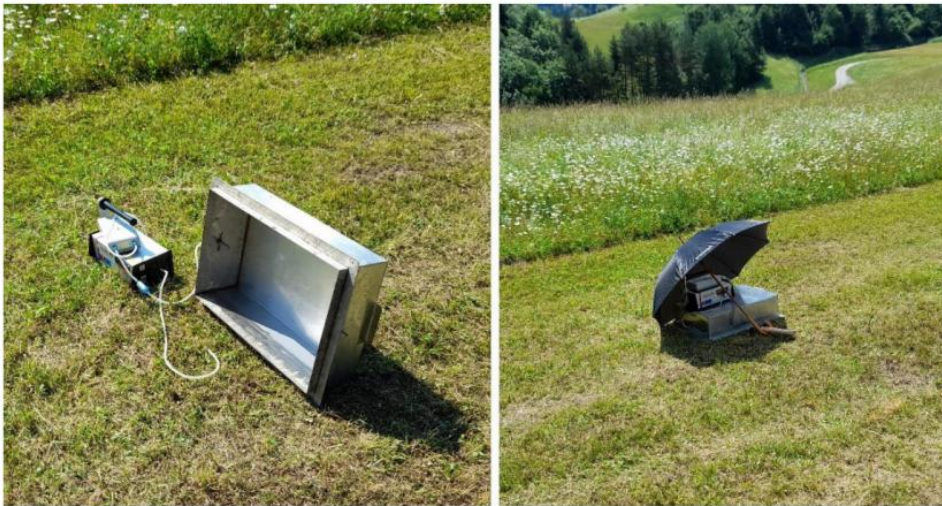
Slika 7: Merilna oprema in izvajanje meritev radonskega toka skozi prekrivko na pobočju odlagališča Jazbec.

V spodnjem delu odlagališča Jazbec in po dolini Brebovščice navzdol je radon, tako kot drugod po Sloveniji, najpomembnejši dejavnik, ki vpliva na izpostavljenost prebivalstva. Po zaprtju odlagališča je ta prispevek k izpostavljenosti majhen in odvisen predvsem od vremenskih razmer in prevetrenosti doline ter merske metode. Rezultati meritev koncentracije radona v zadnjih dveh letih so v okviru povprečnih vrednosti, izmerjenih v prehodnem petletnem obdobju. Iz poročila o varstvu pred ionizirajočimi sevanji in jedrski varnosti v Republiki Sloveniji za leto 2021 lahko primerjamo rezultate povprečne letne koncentracije radona v Gornji Dobravi (25 Bq/m 3 ), Gorenji vasi (24 Bq/m 3 ) in Ljubljani (21 Bq/m 3 ). Izmerjene vrednosti so primerljive.